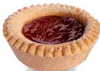
Crostatina con mermelada de albarico- que 50 g - 20 piezas x bolsa Cod. 4186