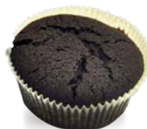
Brownie al chocolate 35 g - 20 piezas x bolsa Cod. 4188