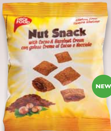
Nut snack Galletita rellena con crema al cacao y avellanas 40 g - 20 piezas x bolsa - Cod. 4198