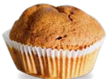
Muffin limón 35 g - 20 piezas x bolsa Cod. 4193