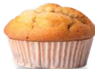
Muffin yogurt 35 g - 20 piezas x bolsa Cod. 4187