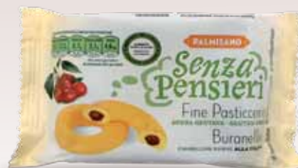
Buranellini 30 g - 20 piezas x bolsa Cod. 4199